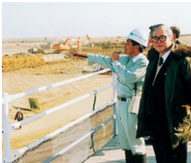
17年度の開港を目指して工事が進む新北九州空港 予定地を視察(平成14年11月22日)