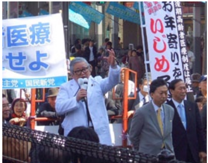
東京・巣鴨の商店街で開いた4野党合同演説会で白衣スタイルで演説。右は鳩山由紀夫前総理(当時:民主党幹事長) (平成20年4月)