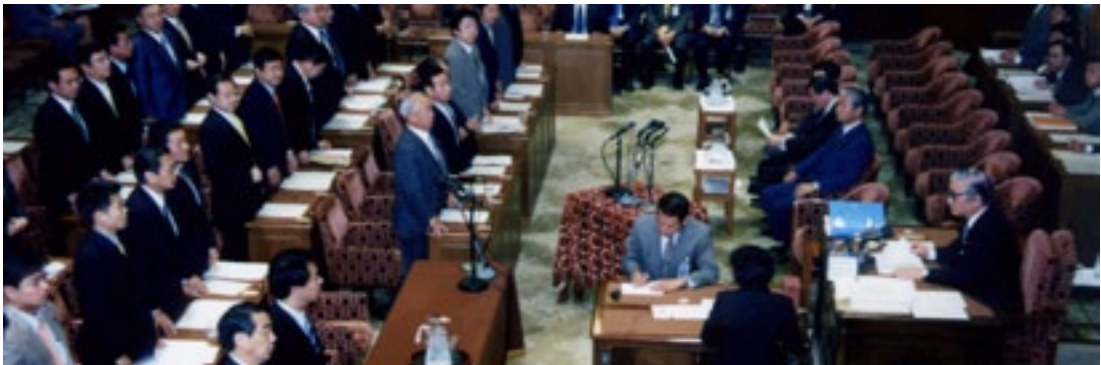
第一五九回通常国会において、衆院武力攻撃事態対処特別委員会の委員長として 「有事関連法案」を審議、通過させる (平成16年5月)