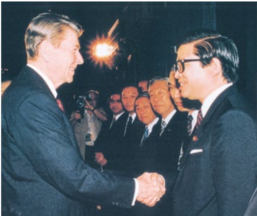
トロントサミットに同行国会議員団員として出席、 レーガン米大統領と握手(昭和60年6月)