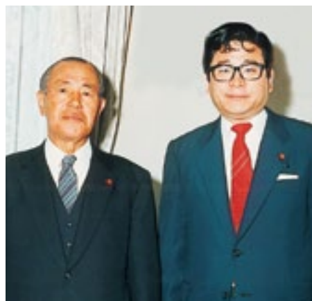
田中角栄元首相邸を訪れ、政治家への道を 決めた(昭和57年5月24日)