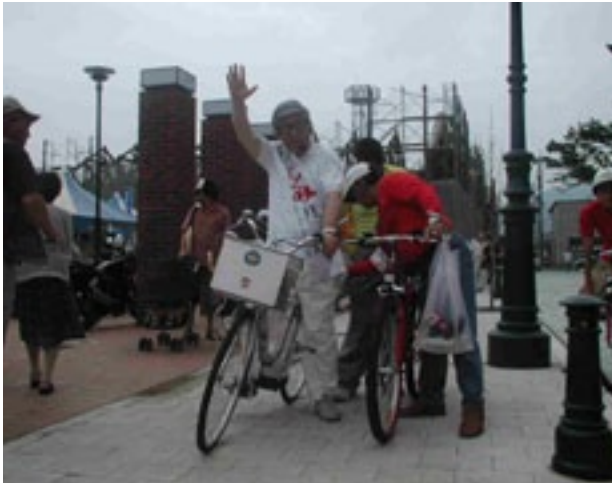
第四十四回衆議院議員選挙で苦杯。八選ならず。 (平成17年9月)