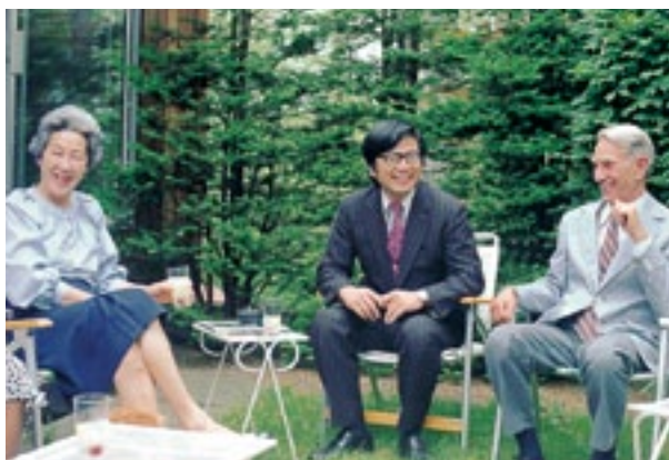
ライシャワー元駐日大使(ハーバード大学教授)とハ ル夫人とボストンの教授宅にて (1981年6月12日)