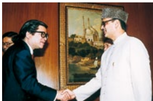
南西アジア視察でシン・インド首相と会談(平成2年5月)