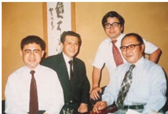
師の故渡辺美智雄氏(右)と山崎拓氏(左) (昭和60年10月)