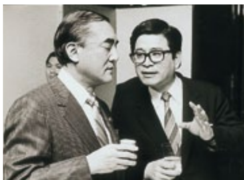
中曽根総理とヒソヒソ談(昭和60年5月)