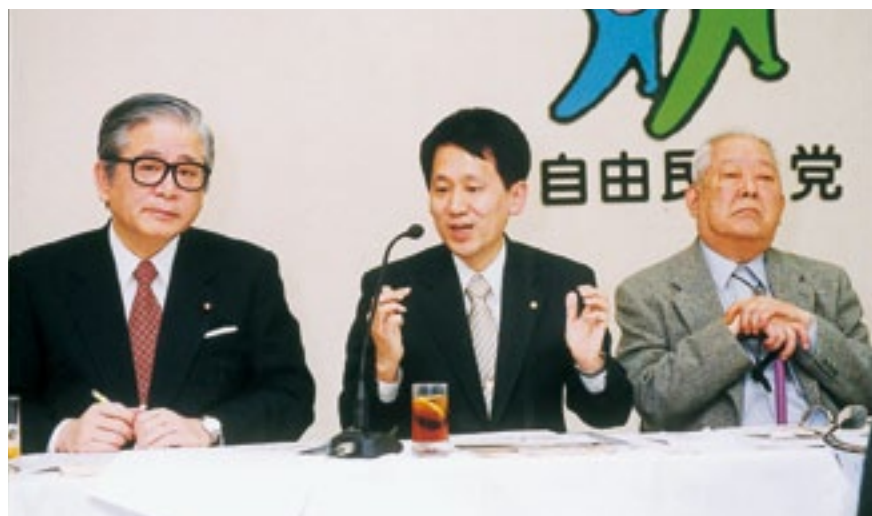
ノーベル賞の小柴・田中両氏と歓談(平成14年11月11日)