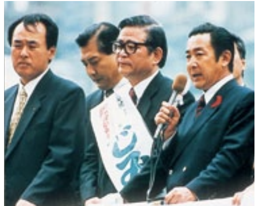
平成8年の総選挙で応援演説する 橋本龍太郎総理JR小倉駅前で