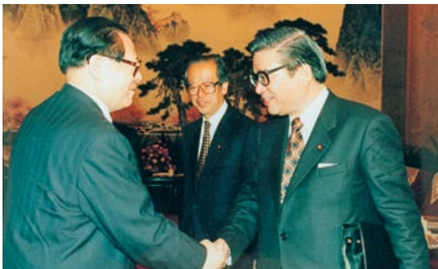
中国を訪問、江沢民主席と会見(平成9年4月30日)