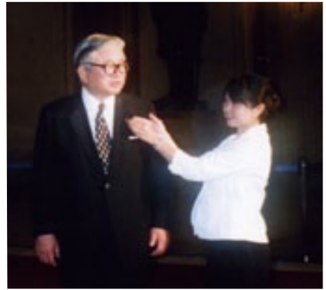
第二十一回参議院通常選挙で、国民新党の公認を受け当選。一年十ヶ月ぶりに国政復帰をはたす。参議院に初登院し、職員にバッジをつけてもらう。 (平成19年7月)