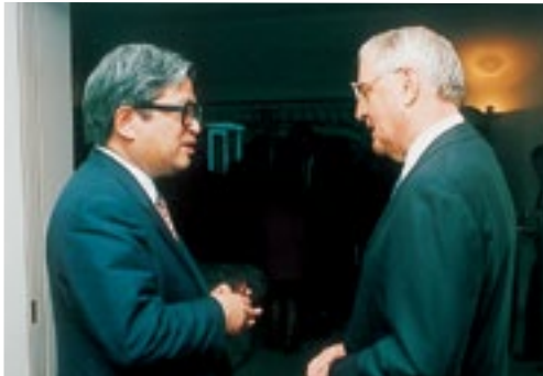
モンデール駐日米大使と話し込む (平成6年5月18日)