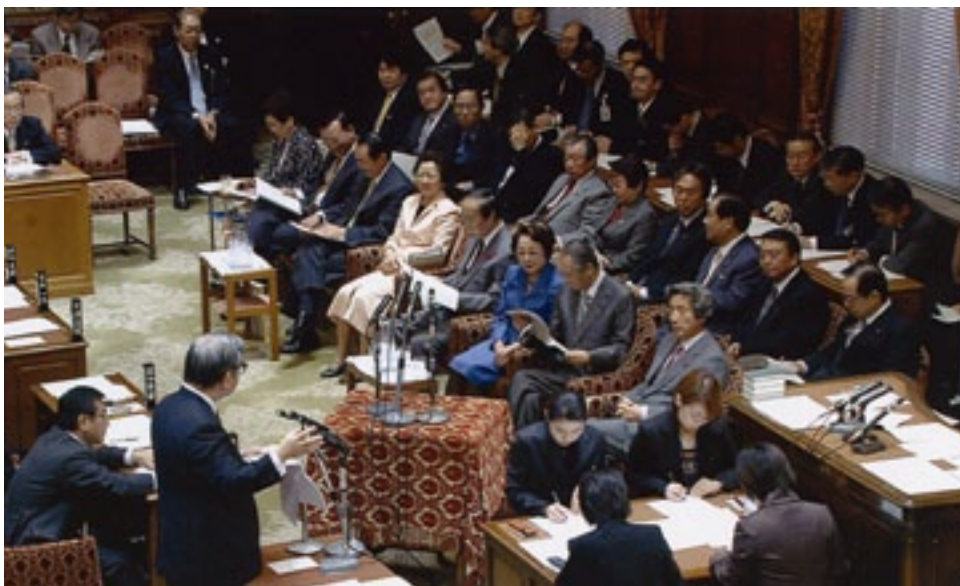
平成14年10月の臨時国会で、予算委筆頭理事に就 任。自民党を代表して質問に立つ (平成14年10月24日) ▼