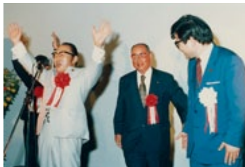
初めての政経セミナーでバンザイの音頭をとる 故渡辺美智雄氏、中央は柳田桃太郎元参院議員 (昭和60年5月11日)