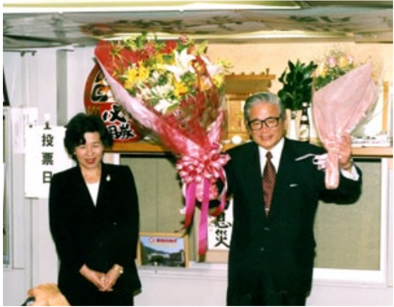
衆議院議員選挙で連続 七回目の当選 (平成15年11月)