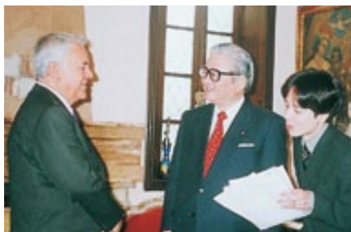
特派大使でボリビア・ラパスへ政府の特派大使として南米・ボリビアを訪れサンチェス・デ・ロサダ新大統領と私邸で会談(平成14年8月6日)