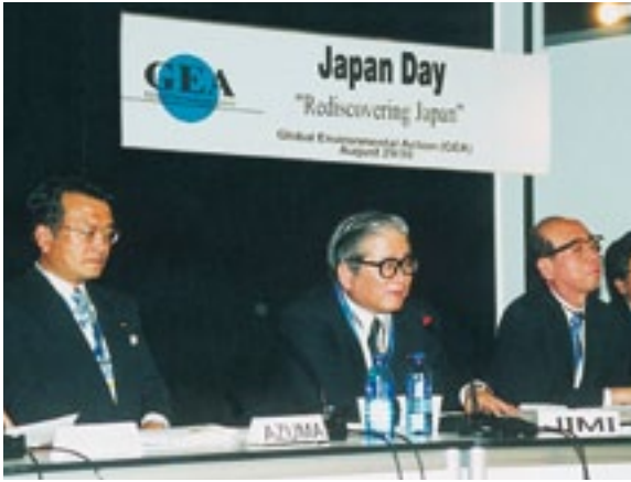
環境開発サミット・ジャパンデーの フォーラムでパネリストとして発言(平成14年)