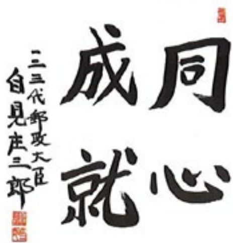
同心成就<自見直筆>