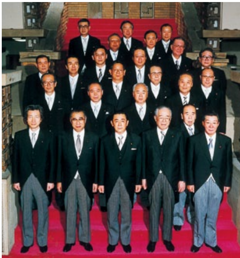
第2次橋本内閣で郵政大臣に就任(平成9年9月11日)