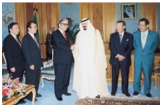
サウジアラビアを訪れ、アブドゥラー皇太子殿下と会見(平成13年8月)