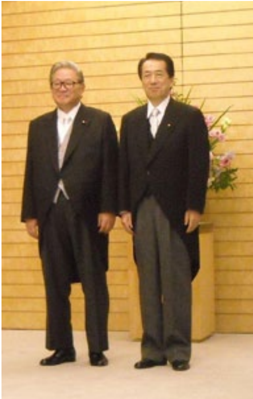
菅内閣にて、金融・郵政改革担当大臣に就任 宮中での認証式を終え首相官邸応接室で菅総 理と撮影 (平成22年8月)