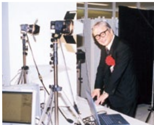
若松区の学研都市であった高度情報通信の研究 施設「北九州 IT 研究開発支援センター」の開所 式に出席(平成14年4月22日)