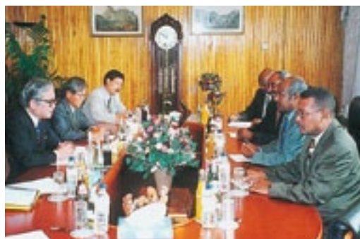
エチオピアを訪れ、セイヨム外務大臣右から2人目)と会談(平成14年9月3日)