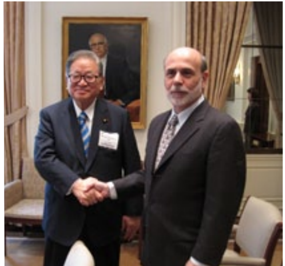
金融・郵政改革担当大臣として米国公式訪問 FRB/バーナンキ議長とワシントンDCにて (平成22年8月)