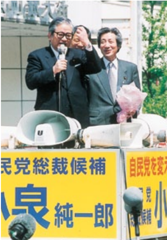
自民党総裁選で小倉北区に遊説した小泉純一郎氏の 応援演説をおこなう(平成13年4月19日)