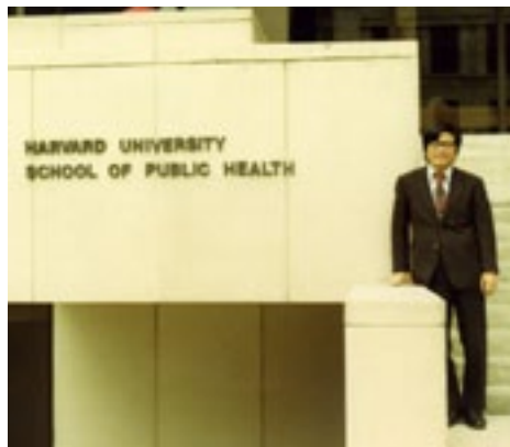
アメリカ合衆国ハーバード大学 公衆衛生学部 疫学教室 主任研究員(1980年)