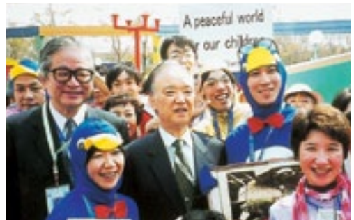
環境開発サミットのNGOのパビリオンでメン バーたちに囲まれて。右は派遣議員団長の海部 俊樹・元首相 (平成14年8月、南ア・ヨハネスブルグで)