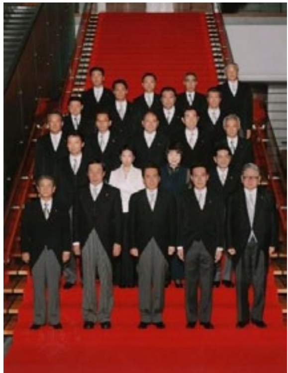
第二次菅改造内閣で金融・郵政改革担当大臣として 留任、首相官邸内で撮影平成22年9月)